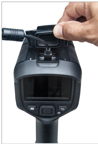
透過USB接口連結電腦