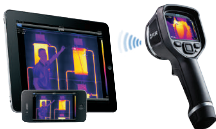
透過無線技術連結手機和平板電腦

* After product registration on www.flir.com