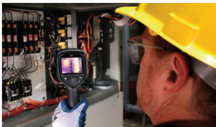
透過紅外線熱影像，快速了解建築牆壁隔熱材或漏水等問題。